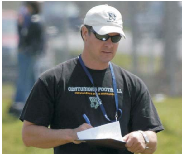
Les Centurions, un mode de vie axé sur la réussite scolaire.